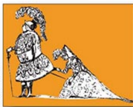
DA ANTON MARRAS ZANETTI

Tre intermezzi di Giuseppe Maria Orlandini